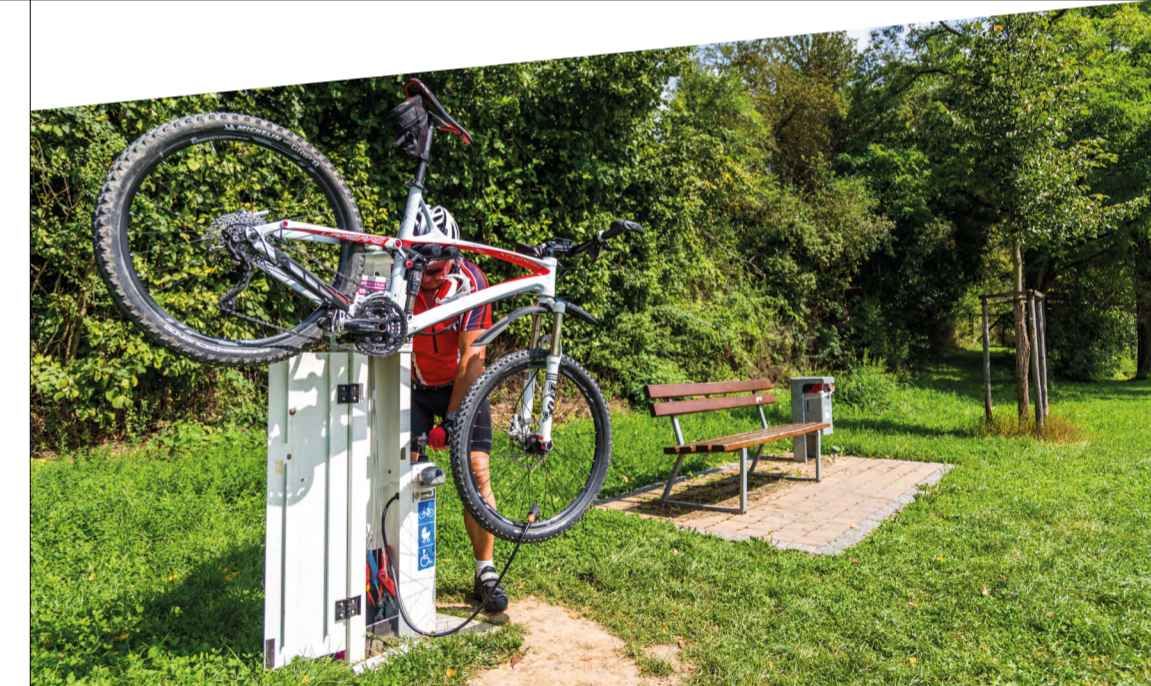
An den frei zugänglichen RadSERVICE-Punkten ist jeweils eine Luftpumpe für alle gängigen Ventile und das wichtigste Werkzeug vorhanden.

Unter Strom – die E-Bike-Tankstellen Im Landkreis haben Sie an zahlreichen E-Bike-Ladestationen die Möglichkeit, das Pedelec oder E-Bike unterwegs aufzuladen. In Bad Wimpfen (Neckartal-Radweg), Möckmühl (Kocher-Jagst-Radweg) und Eppingen (Kraichgau-Hohenlohe-Weg) sind die Lademöglichkeiten in Schließfächern oder Fahrradboxen untergebracht. So können Sie während dem Aufladen Einkerhen oder einen Stadtbummel unternehmen. Die Standorte der Ladestationen finden Sie unter www.HeilbronnerLand.de/E-Bike